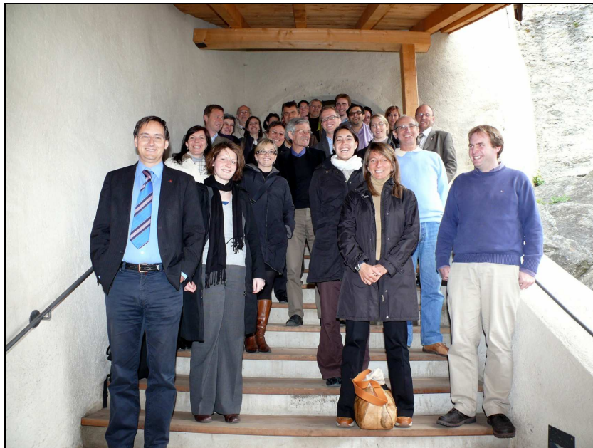
Les partenaires du projet ACCESS